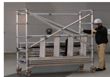
各部材はベース内に収納でき、このままハンドリングOK。

◀本体搬送時のキャスターは軸に対して偏心しておりハンドリングが軽快です。ロックすると直軸となり垂直荷重をしっかりと受けとめます(ブレーキ性能170kg)。