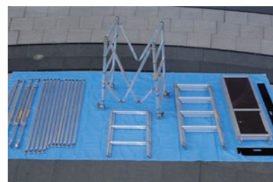
3段(5.3m)タワーの部材一式。