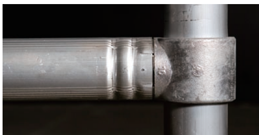
加締による圧着は溶接の数倍の強度を誇ります。

※幅/長さの数値は、パイプ芯々間の寸法です。※作業床積載荷重は床板1枚あたり260kgです。※オプションで8fタイプもございます。 ※仕様は予告なく変更することもございますのでご了承ください。