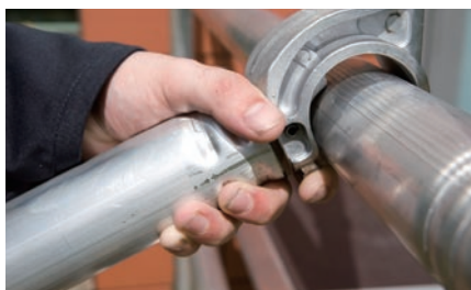
ブレース(筋交)のフックはワンタッチ式ロック付です。先端は衝撃に強い形状です。